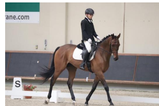
馬術部 愛馬の引退試合となる全国大会で好成績 を収めました！