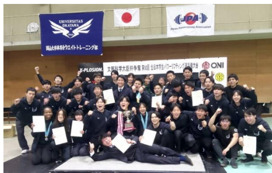
ウェイトトレーニング部 全員で勝ち取ったインカレ団体優勝！