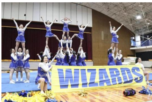
応援団総部チアリーダー“WIZARDS” 定期公演ではじける笑顔と力強い演技を 披露し観客を魅了！

掲載場所： 岡山大学HP > 教育・学生生活・就職 > サークル活動 （校友会ホームページ）